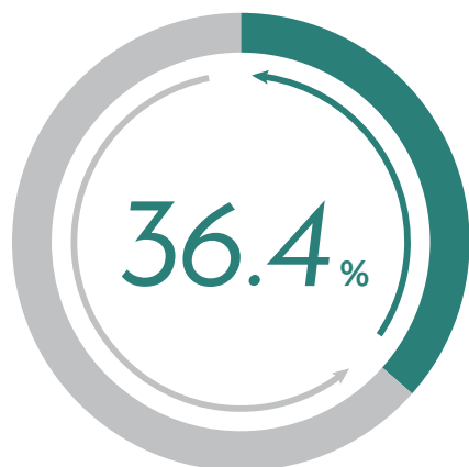
取締役・監査役の 社外役員比率